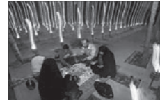
افطار کنار مزار شهدا، کنش ناظر به دیگران

غریبه / آشنا دوست / دشمن گذشتگان / معاصران / آیندگان مؤمن / کافر / منافق با این مثال‌ها، متوجه می‌شوید؛ کنشی که ناظر به هر کدام از موارد بالا صورت می‌گیرد، آداب و قواعد خاصی می‌خواهد. آیا تاکنون فکر کرده‌اید که این آداب چگونه شکل می‌گیرند، چگونه دوام می‌آورند یا تغییر می‌کنند؟ می‌دانید که کنش‌های ما تنها در ارتباط با دیگران انجام نمی‌شوند. کنش‌های ما در ارتباط با خودمان، خلقت (طبیعت و ماوراء طبیعت) و خداوند متعال نیز صورت می‌گیرد. اگرچه انواع کنش‌ها از یکدیگر اثر می‌پذیرند و بر یکدیگر اثر می‌گذارند و متناسب می‌شوند ولی هیت هیچ کدام از دست نمی‌رود. (برای آشنایی با آداب برقراری ارتباط با دیگران، می‌توانید به کتاب مفاتیح‌الحیة اثر آیت‌الله جوادی آملی مراجعه کنید).