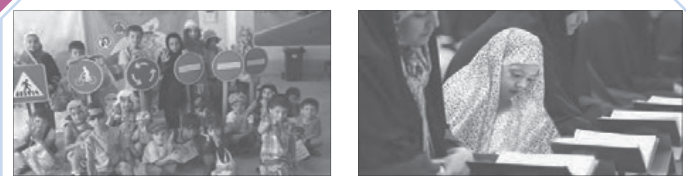
عقاید، ارزش‌ها و هنجارها از طریق جامعه‌پذیری و کنترل اجتماعی به افراد منتقل می‌شوند.

عزم هر فرد برای ازدواج و تشکیل خانواده و تصمیم هر خانواده برای داشتن فرزند، در شیوه زندگی خودشان و دیگران مؤثر است. مثلاً در خانواده‌های تک‌فرزند، نوع ارتباط، محدود به ارتباط پدر و مادر و فرزند است. در این خانواده‌ها، معمولاً کودکان در خانه ارتباط با افراد هم‌سن و سال و