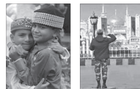
انسان‌ها در انجام کنش به معنای آن توجه دارند.

۵ با توجه به این ویژگی‌ها، کنش انسان – برخلاف فعالیت‌های سایر مخلوقات – «معنادار» است. انسان‌ها با توجه به معنای کنش خود، آن را انجام می‌دهند؛ مثلاً وقتی دانش‌آموزی در کلاس، دستش را بالا می‌آورد، این کار را آگاهانه، ارادی و هدف‌دار انجام می‌دهد و معنای آن اجازه‌خواستن از معلم است. معلم نیز در صورتی می‌تواند به او پاسخ مناسب بدهد که معنای کنش او را بیابد.