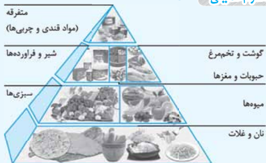
هرم مواد غذایی

توضیح شکل: مواد غذایی که در بالای هرم قرار می‌گیرند، دارای کم‌ترین حجم هستند، به این معنا که افراد باید از این گروه مواد غذایی کم‌تر مصرف کنند (مانند قند و چربی) و هر چه از بالای هرم به سمت پایین حرکت می‌کنیم حجم گروه‌های غذایی بیشتر می‌شود؛ یعنی مقدار مصرف روزانه آن‌ها باید بیشتر باشد.